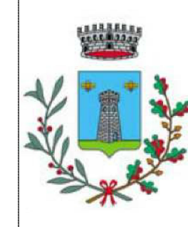
TAVOLA P.d.R. - 02.4 c.d. variante - 1